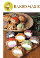
ブランドロゴと看板商品の「焦がしシュークリーム」

看板商品である「焦がしシュークリーム」は、多数のメディアに取り上げられるなど他社にはない商品開発力が強み。関西の主要な駅・空港では大阪土産としての取扱い店舗が飛躍的に拡大し、露出度の増加に比例して、国内外ともにフランチャイズ加盟の問合せが増加している。今後は国内外共にフランチャイズ展開で店舗展開を一気に加速できるように準備を進めている。なお、空港では同社ブランドの浸透で売上が伸びており、世界の消費者から同社商品が評価されているものと考えられる。