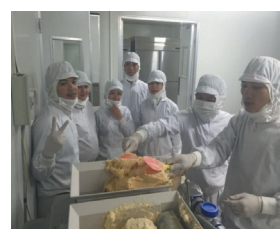
ベトナム人スタッフ

ベトナムに合併会社を設立していることから、相互にマネジメントクラスで活躍できる人材を育てるために、現在30名ほどのベトナム人留学生を採用している。中国への早期進出を見据え、中国人社員の採用も行い、能力や目指すキャリアに応じて本人の将来設計にも資する人材育成を図っている。また、日本語学校の留学生への就労支援を行っており、毎年20名ほどの新規留学生を採用。インバウンド対応と日本食文化の海外普及に貢献しつつ、工夫を凝らした働き方で競争性を確保している。